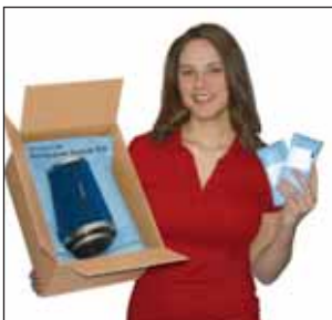
Instapak Quick® RT